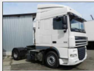
Магистральный седельный тягач 4×2; кабина Space Cab, 2 спальных места; двигатель 462л.с. (евро5); топливный бак (850л); запасное колесо с кронштейном крепления; механическая коробка передач, комплект спойлеров. 91 270 Евро

АВТ Трейд и АВТ Кубань - официальные дилеры HINO Motors Ltd.