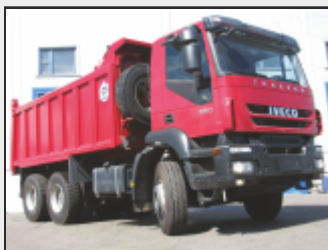
IVECO TRAKKER AT380T38H, новый, кузов Technopak 16 куб. м, 380 л.с., ZF 16, г/п, опции. 4 880 000 руб.