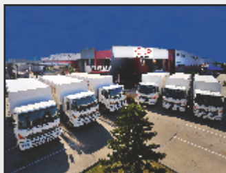
HINO TOYOTA 500. сборка Япония, 2012, г/п 8 т., 260 л.с., турбодизель с интеркуллером, common rail, промтоварный фургон, опции. 2 649 000 руб.