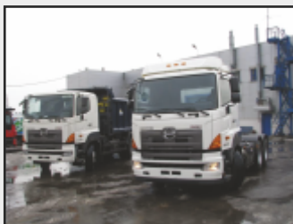
ТЯГАЧ HINO TOYOTA 700, сделано в Японии 6х4, 450 л.с., 1 спальник, ZF16, кондиционер, опции. 4 599 000 руб.