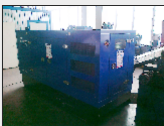
Дизельная электростанция GSNEF60MA в шумоизоляционном кожухе; габаритные размеры 2750×1100×1692мм; общий сухой вес 1590кг; бак 180л; номинальная мощность 60кВА 692 000 руб