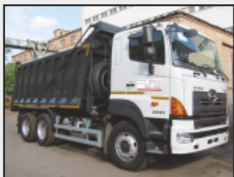
САМОСВАЛ HINO TOYOTA. Сделано в Японии, НОВЫЙ, пробег 0 км.. Белый, 6х4, 16 куб. 410 л.с., кондиционер. 4 449 000 руб.

www.hino-toyota.ru Москва +7(915) 471 0934 +7(916) 158 5514 Краснодар +7(918) 049 0449