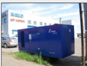
Дизельная электростанция GSNEF130MA в шумоизоляционном кожухе; габаритные размеры 3600×1170×1835мм; общий сухой вес 1860кг; бак 330л; номинальная мощность 130кВА. 1 079 600 руб

www.avtmotors.ru Москва +7(926) 590 2202 +7(926) 602 4120 Краснодар +7(918) 120 0884