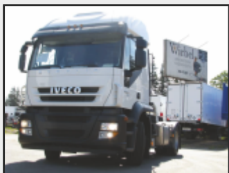
СЕДЕЛЬНЫЙ ТЯГАЧ STRALIS AT440542(45) T/P R R, нов.. 2012 г.в., 420 (450) л.с., баки 1100 л., МКПП ZF 16, м/руль, э/пакет, конди., круиз, ABS, ASR. 3 400 000 руб.

сеть автосалонов и дилерских центров в России, Грузовые и коммерческие автомобили, двигатели и электростанции. Продажа. Сервис. Запчасти.