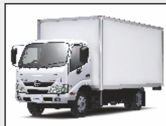
HINO TOYOTA 300, сделано в Японии, г/п - 5 т., НОВЫЙ, Белый, пробег 0 км. Промтоварный фургон 30 м3, опции. 1 730 000 руб.