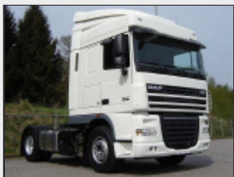
Магистральный седельный тягач 4×2; кабина Space Cab, 2 спальных места; двигатель 408л.с. (евро5); 2 топливных бака (850+430л); механическая коробка передач, комплект спойлеров. 90 650 Евро

www.avt-daf.ru Москва +7(916) 503 0365 Краснодар +7(918) 049 0049 +7(918) 120 0884