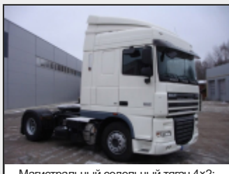
Магистральный седельный тягач 4×2; кабина Space Cab, 2 спальных места; двигатель 408л.с. (евро5); топливный бак (850л); запасное колесо с кронштейном крепления; механическая коробка передач, комплект спойлеров. 90 000 Евро