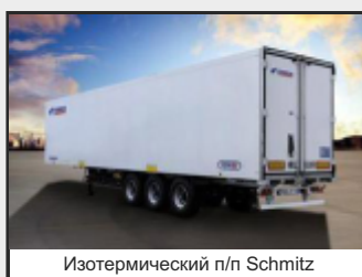
Изотермический п/п Schmitz CARGOBULL тип SKO 24/L - 13.4 FP 60 cool (объём 86м3, подъемная передняя ось, корзина на 2 запасных колеса, ящик для 36 европоддонов, установка CARRIER MAXIMA 1300). 73 000 Евро