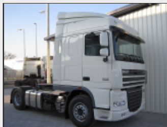
Магистральный седельный тягач 4×2; кабина Space Cab, 2 спальных места; двигатель 462л.с. (евро5); 2 топливных бака (850+430л); механическая коробка передач, комплект спойлеров. 91 890 Евро