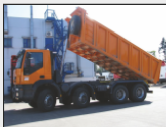
IVECO TRAKKER AD410T42H, НОВЫЙ, пробег 0 км., оранжевый, 8х4, 420 л.с. 5 499 000 руб.